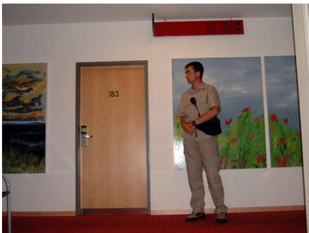
Varna hiša

samo z tem manevrom zagotovimo dodatno stopnjo varnosti varovani osebi. Ob takem varovanju izvajamo naloge skladno s 5. poglavjem teme »Taktika varovanja varovanih oseb«, Rezidenčno varovanje.