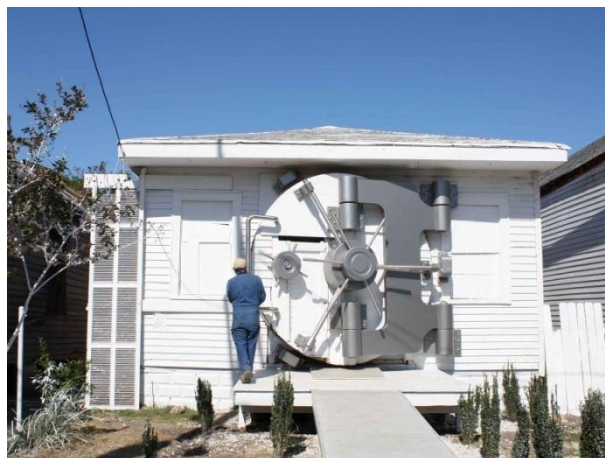
Varna hiša – bolj za šalo